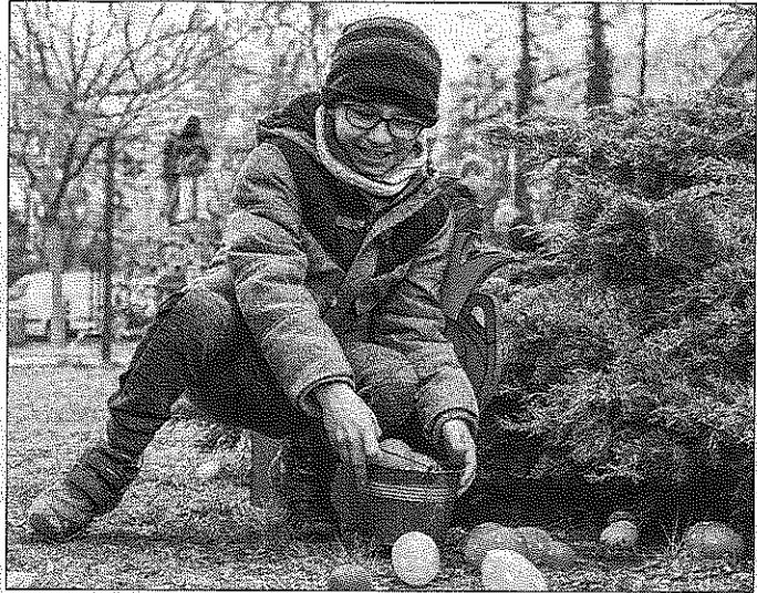
La chasse œufs, une animation particulièrement prisée des enfants.

Parmi les intervenants, le périscolaire qui vendait porte-clés, bougies, sabots, confitures maison... Les bénéfiques iront à la SPA de Strasbourg. Des associations et entreprises de la commune faisaient profiter de leur savoir-faire, tel Pas-