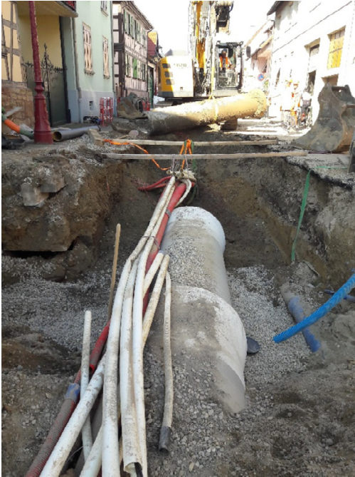
Schéma Directeur Assainissement – GEISPOLSEIM-VILLAGE

Les travaux du schéma directeur d'assainissement accompagnés de travaux d'eau potable ont repris le 30 juin dernier rue du Général de Gaulle et vont se poursuivre jusqu'à la fin de l'année 2021. Des aléas de chantier ont ralenti la pose des nouveaux réseaux rue du Général de Gaulle. De nouvelles mesures de circulation sont ainsi nécessaires pour terminer ce chantier de lutte contre les inondations.