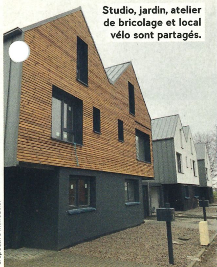
Studio, jardin, atelier de bricolage et local vélo sont partagés.

Mixité architecturale et dimension conviviale: le Domaine des forts, signé Perspective immobilier, se distingue des programmes classiques qui fleurissent un peu partout. Il a été pensé «pour favoriser les échanges et la solidarité entre voisins, tout en respectant la vie privée, l'espace et l'identité de chacun», selon ses concepteurs. On y trouve notamment un studio équipé, que les habitants peuvent utiliser en cas de visite de famille ou d'amis, un jardin et un potager partagés, un atelier de bricolage. Un vaste local intérieur est dédié aux vélos: pas uniquement à leur stationnement, mais aussi à leur réparation et à leur entretien. Pour mener à bien le projet, il a été fait appel à l'association Éco-Quartier Strasbourg. Son représentant, Emmanuel Marx, est à la manœuvre, et il organise des rencontres entre les copropriétaires. La première tranche a été livrée fin 2020, la seconde arrivera au printemps. Le promoteur strasbourgeois de l'opération annonce d'autres projets en cours dans l'Eurométropole, à la Wantzenau, Achenheim et Niederhausbergen. ● P.S.