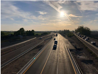
A 7h00, l'A35 vers Colmar et la nouvelle bretelle de sortie vers Geispolsheim et Entzheim étaient mises en service