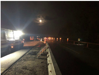
La mise en place du basculement sur la nouvelle voirie de la circulation en provenance de Strasbourg a été réalisée à 4h00

Comme planifié, les opérations de basculement sur la nouvelle chaussée de l'A35, dans le sens Strasbourg vers Colmar, et la mise en service de la nouvelle bretelle de sortie vers Geispolsheim et Entzheim ont eu lieu dans la nuit du 26 au 27 avril. Au petit matin, tous les mouvements étaient opérationnels !