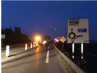
Le giratoire Nord, et notamment le sens Entzheim vers Geispolsheim et Strasbourg, a été ré-ouvert à la circulation

Retrouvez sur le site internet de la DREAL Grand Est, rubrique « Informations travaux A35 à Strasbourg », l'ensemble des modalités d'exploitation sur l'A35 pour la période allant de mars à octobre 2018 : www.grand-est.developpement-durable.gouv.fr . Pour toute question, le Pôle de Maîtrise d'Ouvrage Routière de Strasbourg de la DREAL Grand Est est à votre disposition (par courriel ou au 03 88 13 07 80).